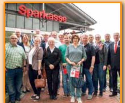
Sparkasse Nienburg übergibt 20.000 Euro an Sportvereine Seite 7