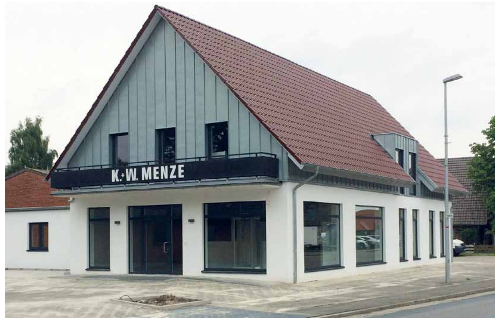
Hier ist jetzt die Firma Menze Haustechnik ansässig: Hauptstraße 27

Nach fast 90 Jahren Firmengeschichte an der Hauptstr. 23 zog die Firma Menze Haustechnik 200 Meter weiter in die Hauptstr. 27 gegenüber den ansässigen Dienstleistern um.