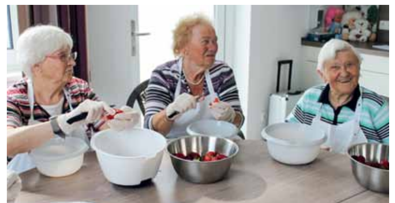
Die Erdbeerbowle für das Grillfest wird vorbereitet

Wegen Regen sollte kein Fest ausfallen. Das haben sich die Mitarbeitenden des CuraZentrum Lavelsho auch gedacht und machten aus dem Grillfest kurzerhand eine Indoor- Veranstaltung.