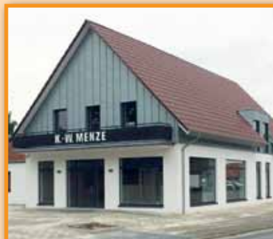
Neue Adresse für Menze Haustechnik Seite 6