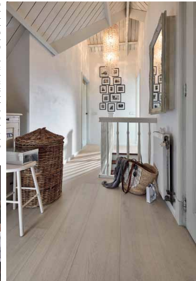
In helleren Varianten harmoniert der Holzboden perfekt mit aktuellen skandinavischen Einrichtungstrends