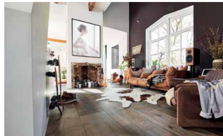
Vielfarbige Oberflächen bringen viel Varianz in die Bodengestaltung und erleichtern das Einrichten

herunterfallende Gegenstände lassen diesen Boden unbeeindruckt. Das bestätigen auch Labortests: Eine Metallkugel mit 4.000 Newton Druck hinterlässt auf herkömmlichem Parkett einen deutlich sichtbaren Eindruck. Beim Lindura-Holzboden entstehen dabei kaum wahrnehmbare Spuren. Nicht nur die technischen Eigenschaften stimmen, auch die Optik überzeugt: Eleganter Nussbaum, rustikale Eichenoberflächen im modernen Vintage-Look oder harmonisch-helle Töne, die perfekt mit aktuellen skandinavischen Einrichtungstrends harmonieren, stehen zur Wahl. Die attraktiven Landhausdielen-Formate (220 x 27 cm; 260 x 32 cm) kommen übrigens besonders in großzügigen Räumen perfekt zur Geltung. Holzböden von Meister gibt es im qualifizierten Fachhandel oder direkt online auf www.markenboden.de