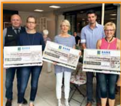
EDEKA Röthemeier: Spende für den guten Zweck Seite 5